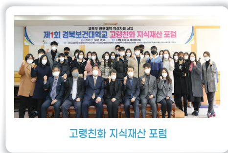
고령친화 지식재산 포럼