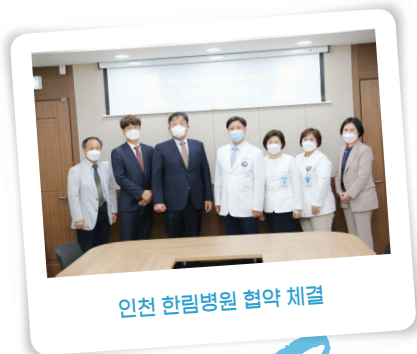
인천 한림병원 협약 체결