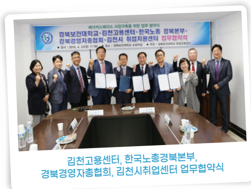
김천고용센터, 한국노총경북본부, 경북경영자총협회, 김천시 취업지원센터 업무협약식